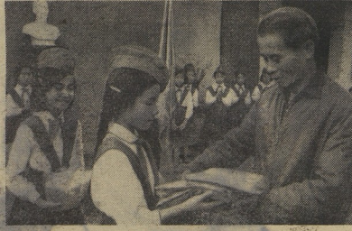
А пионеры Севера переехали подарили для своих сверстников, живущих на Юге.

А. СЕРВИН, корреспондент «Правды» (Специально для «Пионерской правды».)